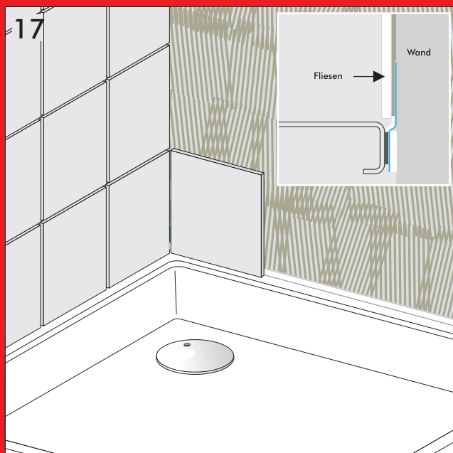
Fliesen und Fugen.